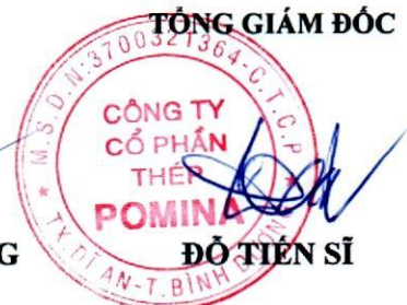
ĐỖ TIÊN SĨ