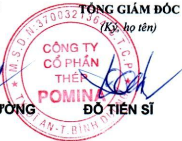
ĐỖ TIẾN SĨ